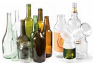
Bouteilles en verre Pots et bocaux en verre