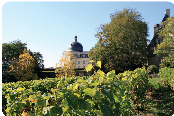
© Vignes et Château de Valençay - Enola Création

Vivre à Valençay, c'est aussi profiter d'un cadre de vie agréable offrant des espaces de promenades où la nature est préservée, des parcours de pêche le long du Nahon, des sentiers de randonnées. Plus de 60 associations proposent toute l'année de nombreuses activités et manifestations pour tous les âges.