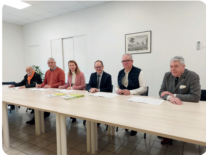
© Signature de la Convention avec la CAF - CCEV

Le 21 mars, la Caisse d'Allocations Familiales de l'Indre signait, avec la CCEV et les communes de Valençay, Écueillé et Luçay-le-Mâle, la nouvelle Convention Territoriale Globale pour la période 2023-2026. Cette convention scelle la coopération entre les services enfance-jeunesse de la CCEV, des communes concernées et la CAF.