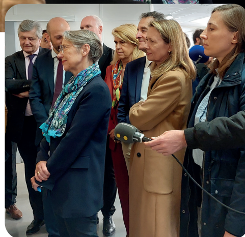
© Visite de la Première Ministre à l'Espace Gâtines - CCEV