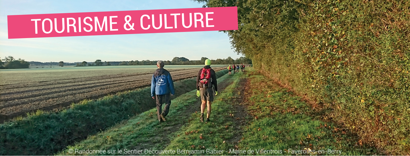
© Randonnée sur le Sentier Découverte Benjamin Rabier - Mairie de Villentrois - Faverolles-en-Berry.