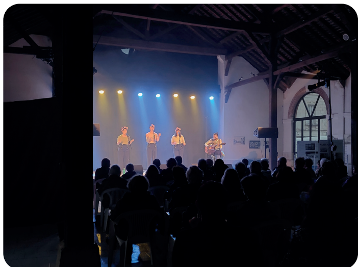
Les Pop Corn Ladies au Festival de la Voix

Plus de 130 personnes ont assisté au concert le 13 mai 2023.