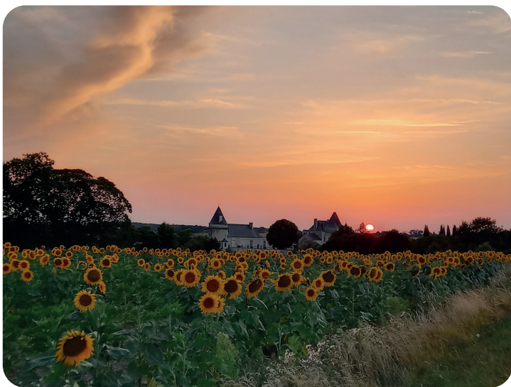
© Vue sur Luçay-le-Mâle - Commune de Luçay-le-Mâle

L'empire romain octroyait à ses officiers à leur retraite une propriété sur les terres conquises. Lucius, "la lumière", devint ainsi maître de notre territoire. Une villa, un aqueduc et des thermes furent