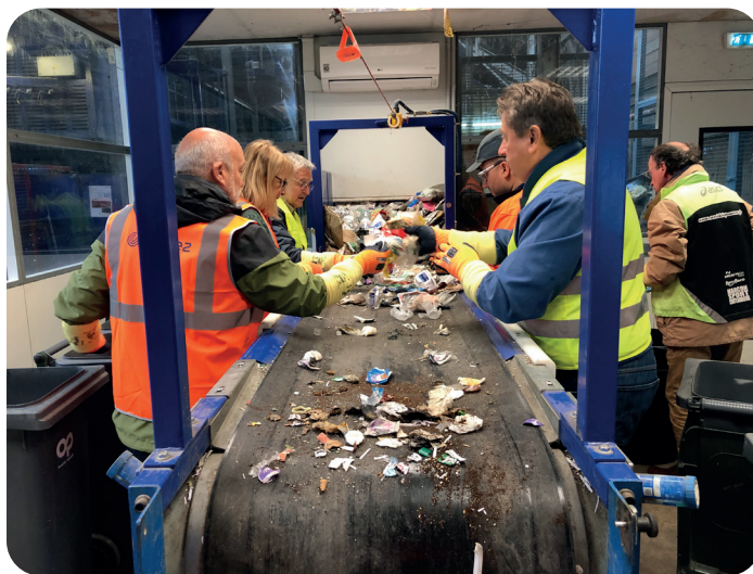
© Visite des élus - CCEV

Ainsi 1 m 3 de déchets réceptionnés de la CCEV est prélevé et mis sur un tapis de tri. Ils sont triés par matériaux. Il en existe 19 types : plastique souple, acier, plastique rigide, bouteille transparente, brique, aluminium, cartonnette, papier, refus de tri... Les contenus de la poubelle de tri vont avoir un parcours différent en fonction de leurs matériaux. Le centre de tri permet de séparer les matériaux grâce à un tri balistique, optique et manuel. Des opérateurs s'assurent de la qualité du tri et écartent les dernières erreurs. Les balles par matériaux sont réalisées puis expédiées dans des usines de recyclage.