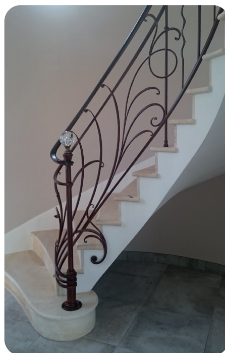
© Exemple de réalisation - Joël BEAUDOIN