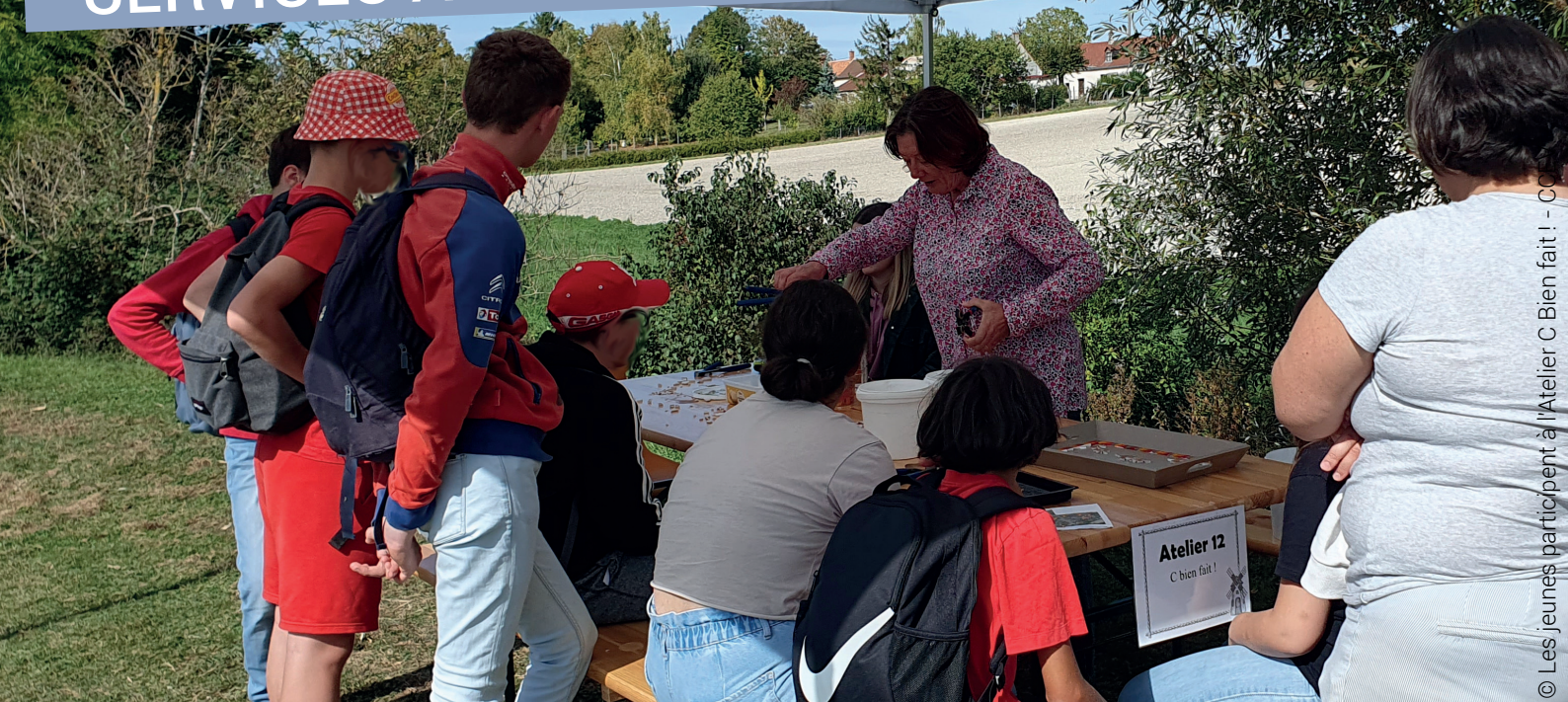
© Les jeunes participent à l'Atelier C Bien fait ! - CC