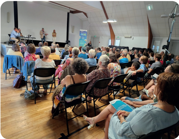
© Conférence - spectacle du 14 septembre - CCEV

La soirée s'est clôturée par le spectacle "Le Cabaret des Métamorphoses" de la compagnie Spectabilis. Une belle réussite avec plus de 100 personnes présentes. Les échanges autour des enjeux de demain ont pu se faire avec humour et dans la bonne humeur !