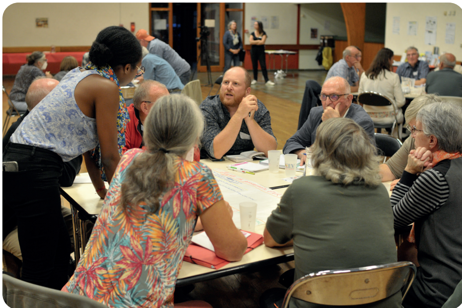
© Les participants lors du 1 er atelier du 3 octobre - Région Centre-Val de Loire

Il s'agit là des premiers pas vers une véritable réalisation d'actions collectives. Un grand merci à toutes les personnes impliquées pour un territoire moins énergivore !