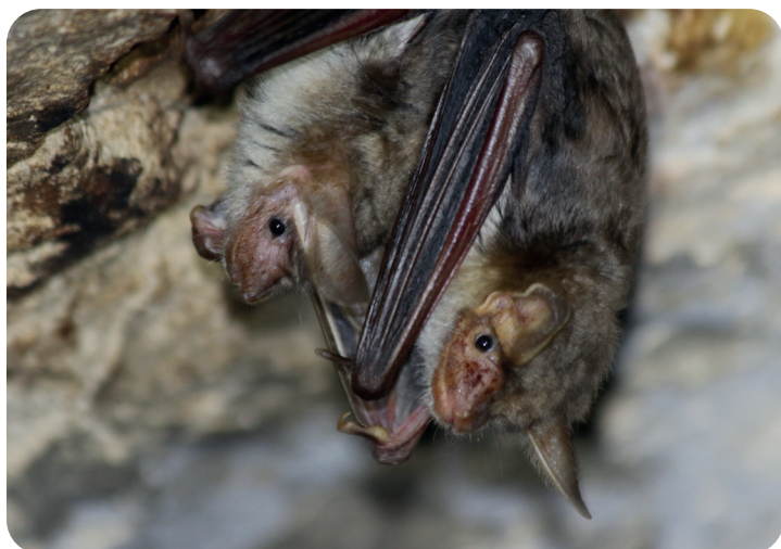
© Grands Murins au Château de Valençay - Lauriane OLIVIER