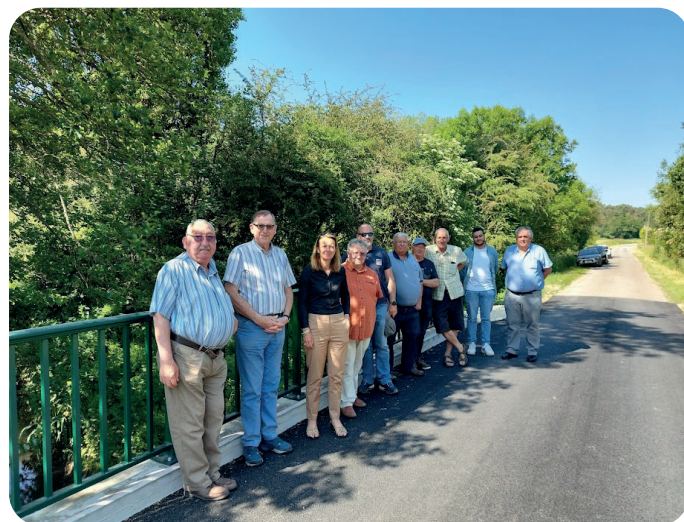
© Réception de travaux en présence des élus - CCEV

Coût de l'ouvrage : 247 000 € TTC Subventionné par l'État et le Conseil Départemental de l'Indre