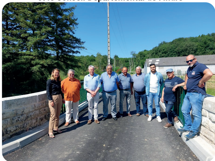
© Réception de travaux en présence des élus - CCEV

Coût de l'ouvrage : 273 000 € TTC Subventionné par l'État et le Conseil Départemental de l'Indre