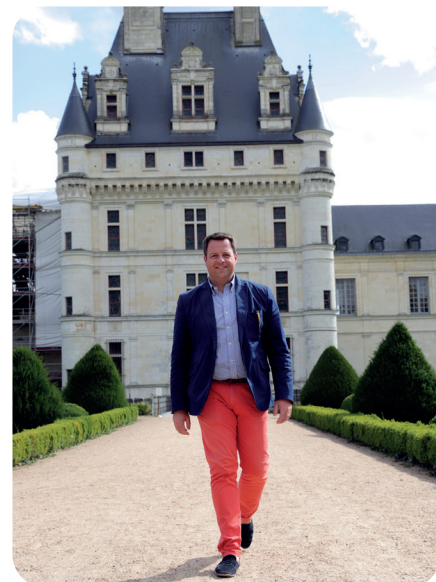
© Alexis Rousseau-Jouhennet - Château de Valençay

Horaires d'ouverture et programme sur : www.chateau-valencay.fr