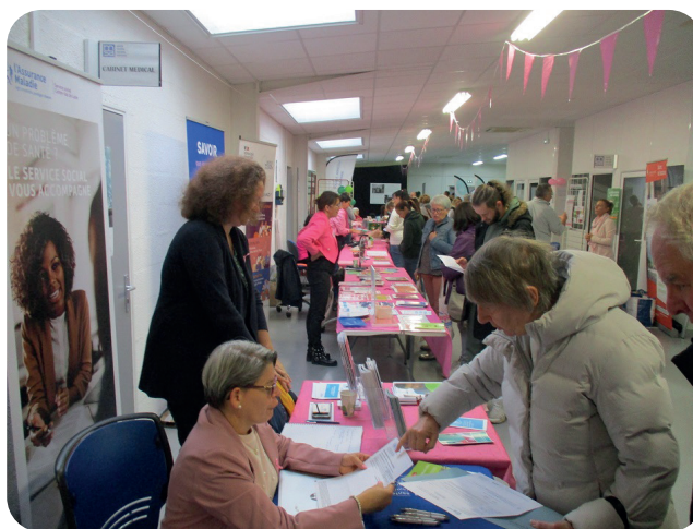
© Événement Sein-plement femme - Didier MALET

Un beau succès pour cette journée sur le thème "Prévenir et guérir", riche de rencontres et de partages !