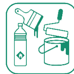
DÉCHETS DIFFUS SPÉCIFIQUES (DDS)

✓ Triés par matière puis réemployés ou recyclés