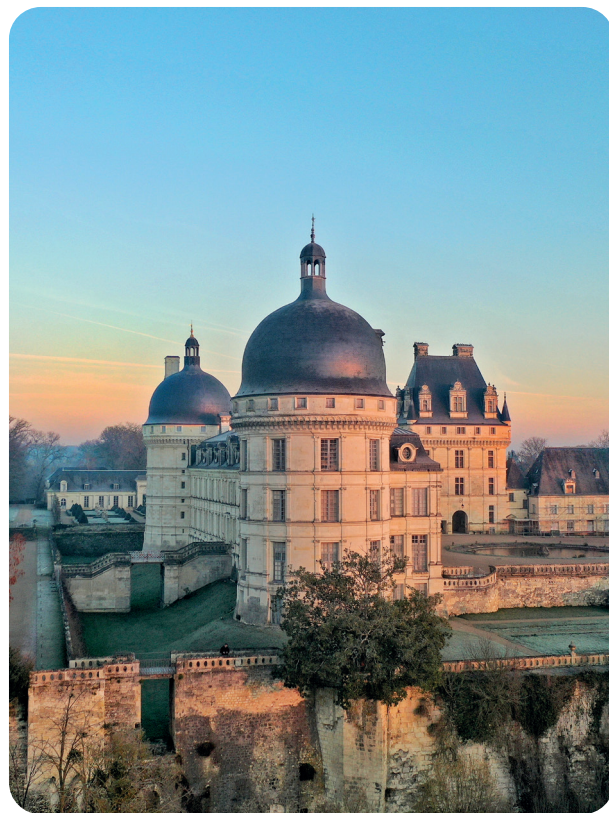
© Vue aérienne Château de Valençay - Pierre HOLLEY

Tél 02 54 00 10 66 / accueil@chateau-valencay.fr www.chateau-valencay.fr