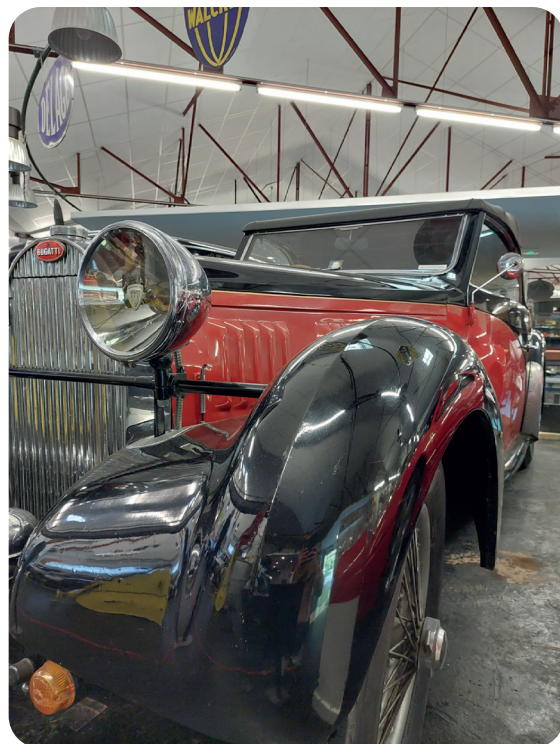
© Bugatti présente au Musée - CCEV