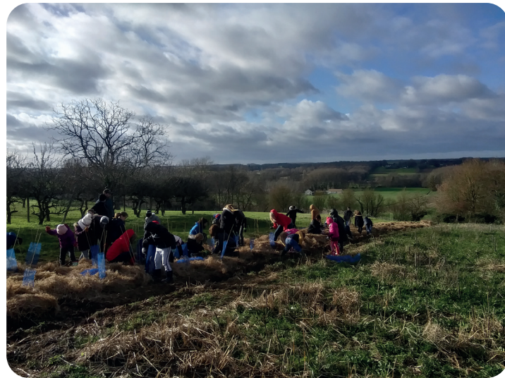
Chantier de plantation haies

Le Projet BOCAGE : ce projet d'aménagement paysager initié il y a 10 ans a pour but d'accompagner