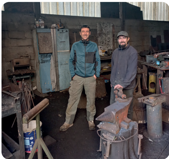
© Tristan CARATY & Damien THEBAULT - CCEV

Les Forges du Bas Berry étaient nées et la nouvelle entreprise choisissait Écueillé comme terre d'adoption. Pour se faire connaître, Tristan CARATY a profité de salons et d'expositions pour faire la démonstration de son talent devant une forge et conquérir, petit à petit, une clientèle sensible aux créations sur-mesure.